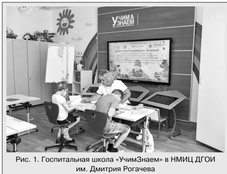
Рис. 1. Госпитальная школа «УчимЗнаем» в НМИЦ ДГОИ им. Дмитрия Рогачева