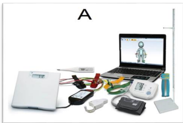
Рисунок 3. АПК с компьютерной интеграцией данных

Антропометрические данные обследуемого ребенка необходимо сопровождать следующими обязательными сведениями о нём: